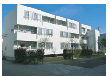
12月に外装のリノベーションが終了しました。

東急ハンスとのコラボレーション住宅。約2畳の押し入れを多機能空間にリノベーション。スペースを効率よく使い、実現した驚きの収納力と機能性が支持されている。全戸南向きなので、日当たりは抜群。徒歩圏内には、OKストア(スーパーマーケット)や商店街があって買い物も便利。水辺空間に癒され、保育園、幼稚園、小学校も近い。まさに子育て世代にピッタリの物件。