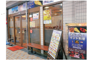
パーティーメニューも充実!

石窯で焼いたナンは、モチモチで食べごたえ十分。カレーは20種類以上のスパイスを使用したスガバオリジナル。ランチはチキン、ベジタブル、キーマエッグ、エビ、日替わりの中から選べる。カレー2種類とナン&ライスにサラダ、ドリンク付きのCセット(900円)が人気。家族連れのパーティーにも対応している。