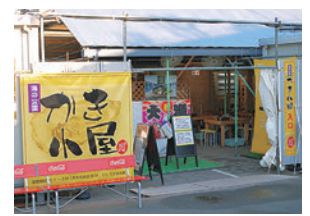
炭火を囲んで皆でワイワイ

☎080(1218)3967 金沢区海の公園 柴口駐車場 10:30~L.020:30 3月31日まで無休