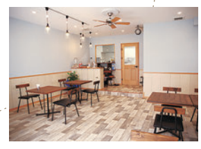
わんちゃん連れてなくても、お気軽に

3 Trimming&Cafe +Wan ぶらすわん 鳥浜駅徒歩3分 ☎045(873)1211 金沢区富岡東2-5-28 1F 9:30~18:00 月曜定休(祝日の場合は火曜)