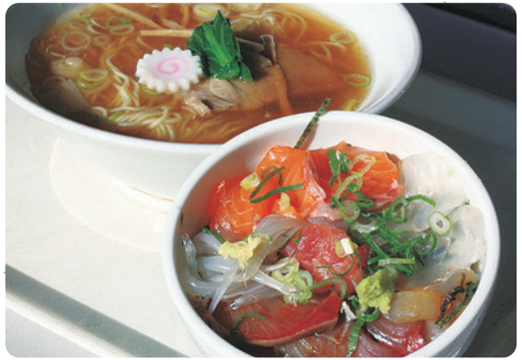
自家製の土佐醤油が名脇役

南部市場内に店を構える「がってん食堂」。屏風ヶ浦のラーメン店が前身とあり、日替わりラーメンセットが圧倒的な人気。市場で仕入れる旬の魚介を使った丼がついて750円は嬉しい。透き通ったラーメンスープに合うと評判だ。毎月第1・3土曜は場内「神水産」で買った魚を持ち込むとおいしく料理してくれる。