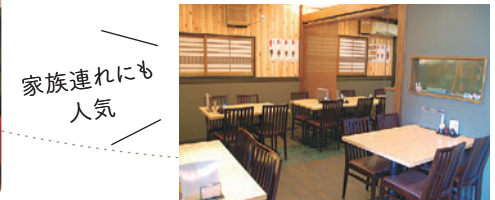
家族連れにも人気

☎045(701)2268/金沢区平湯町23-20 ランチ11:30~L.014:30 ディナー17:00~L.022:30 水曜、第2火曜定休