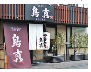
鳥の旨味がギュッ!!

2 鳥真 金沢八景駅徒歩2分 ☎045(783)8910 金沢区瀬戸16-20 ランチ11:00~15:00 ディナー17:00~23:00 日曜・祝日定休