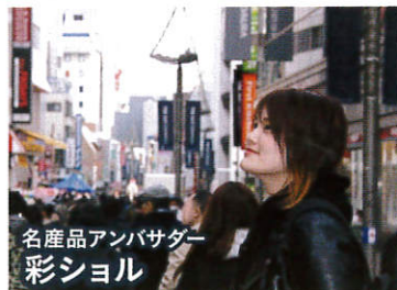
名産品アンバサダー 彩シヨル