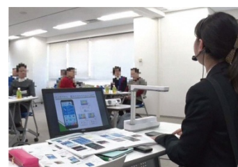
スマホ教室の様子