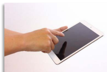
体験でご使用いただく タブレット(イメージ)