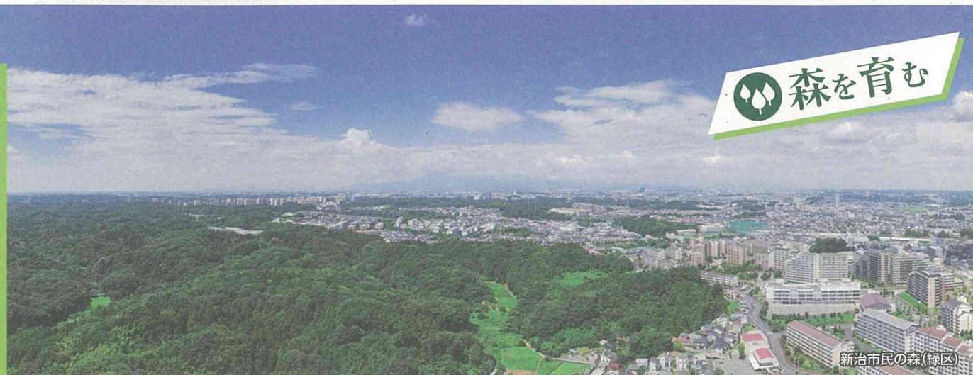
新治市民の森(緑区)