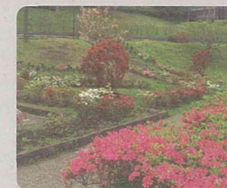
久良岐公園(港南区)