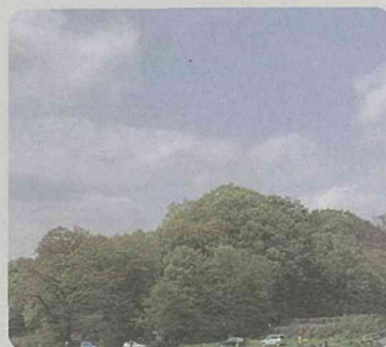
寺家町居谷戸特別緑地保全地区(青葉区)