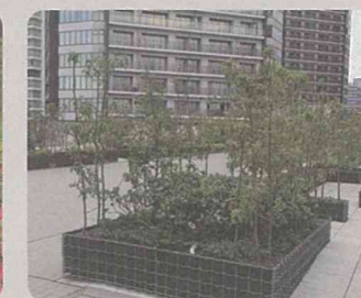
キングモール橋(西区)