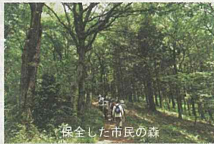
保全した市民の森