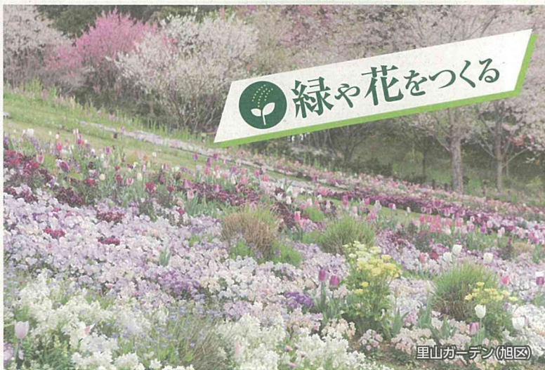
里山ガーデン(旭区)

緑の減少に歯止めをかけ、「緑豊かなまち横浜」を次世代に継承するため、「横浜みどり税」を財源の一部として活用しながら、「横浜みどりアップ計画[2019-2023]」を進めています。このリーフレットは、2020(令和2)年度に実施した事業の実績を、概要としてまとめたものです。