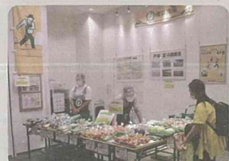
戸塚区地産地消PR・直売コーナー (戸塚区)