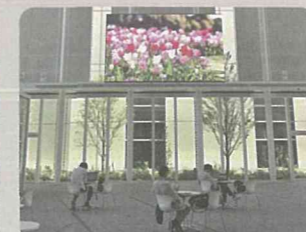
横浜市役所アトリウムでの動画放映