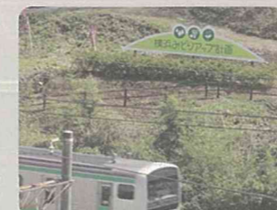
線路沿いでの現地表示看板の設置