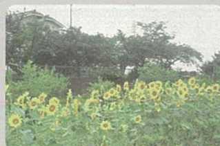
農地縁辺部への植栽(泉区)