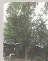
名木古木の指定 (鶴見区)