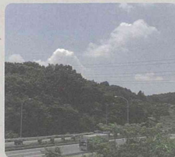
長津田町長月特別緑地保全地区(緑区)