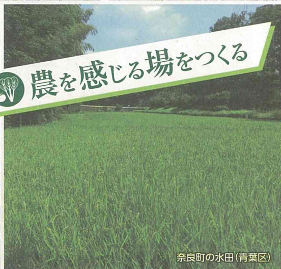
奈良町の水田(青葉区)