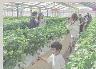
収穫体験農園(神奈川區)