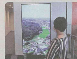
市庁舎デジタルサイネージでの動画放映