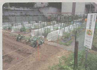
認定市民菜園(青葉区)