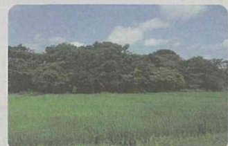
保全された水田(瀬谷区)