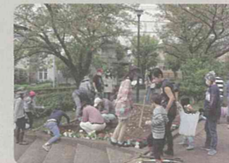
花壇の寄せ植えイベント(青葉区)