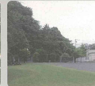
小学校での緑の創出・育成(栄区)