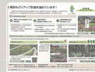
広報よこはまへの取組実績の記事掲載