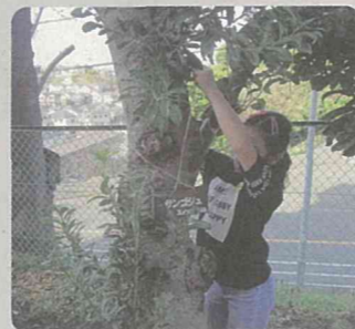
間伐材を活用した樹名板の取付け(南区)