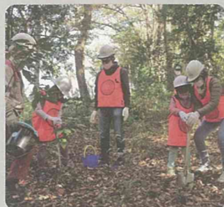
森づくり体験会(緑区)