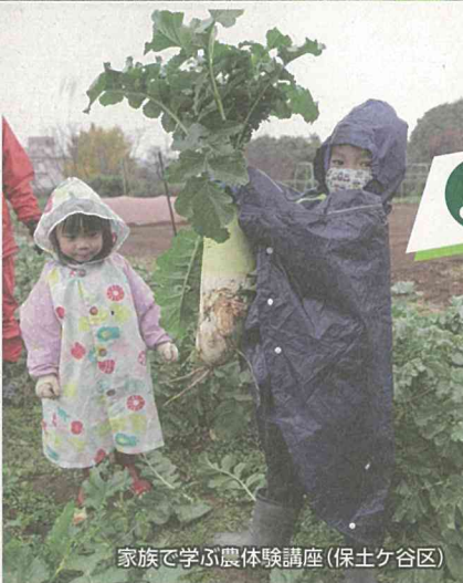
家族で学ぶ農体験講座(保土ケ谷区)