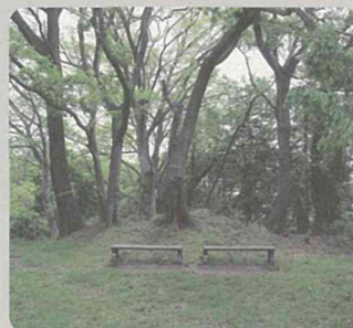
維持管理を実施した樹林地 (称名寺市民の森/金沢区)