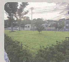
公共施設等での緑の創出 (市立脳卒中・神経脊椎センター/磯子区)