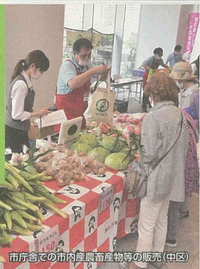
市庁舎での市内産農畜産物等の販売(中区)