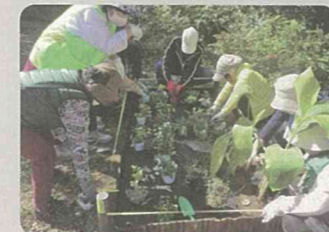
地域緑のまちづくり(港北区)