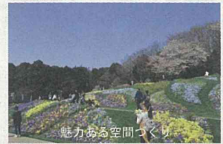
魅力ある空間づくり