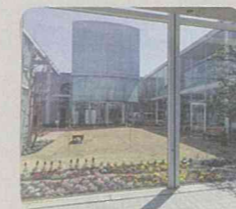
公共施設等での緑の創出 (下和泉地区センター/泉区)