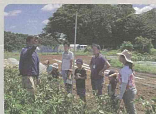
はまふらんどコンシェルジュ活動支援 (保土ヶ谷区)