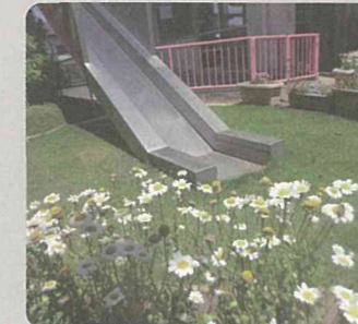
保育園での緑の創出・育成(旭区)