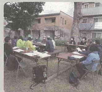
保全管理計画策定の様子 (上矢部ふれあいの樹林/戸塚区)