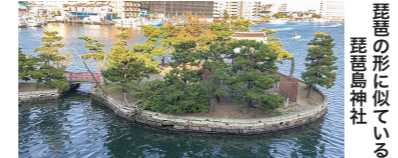
■ 瀬戸神社 琵琶島神社 / シーサイドライン金沢八景駅徒歩2分 (金沢区瀬戸18-14)