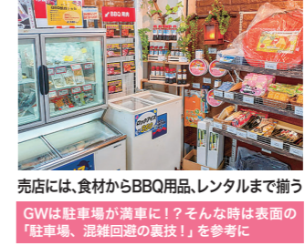
バラエティーセット2500円 (2人前から)

売店には、食材からBBQ用品、レンタルまで揃うGWは駐車場が満車に!? そんな時は表面の「駐車場、混雑回避の裏技!」を参考に