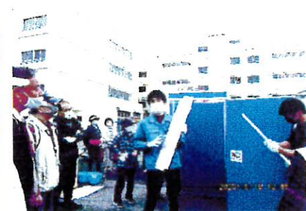
トイレハウス組立