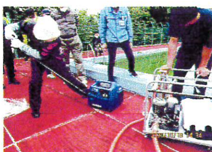
ガス式発電機運転