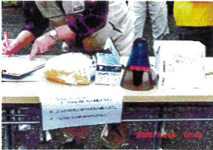
参加者受付・検温マスク着用