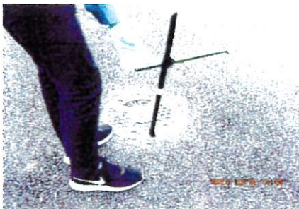
マンホール専用ボール