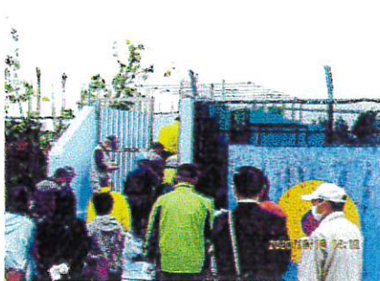
プールサイドへ移動