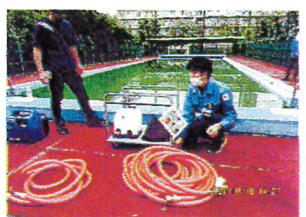
送水ポンプとホース