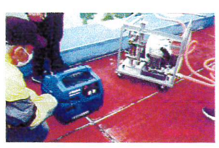
送水ポンプとガス式発電機