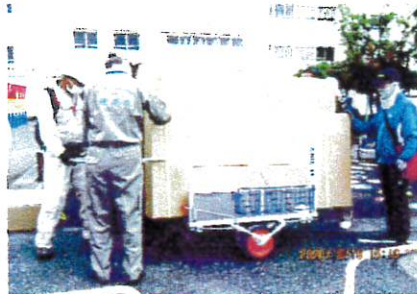
トイレハウス搬出