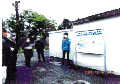
指導者・ハマッコトイレ説明