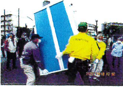
トイレハウス・便器へ移動