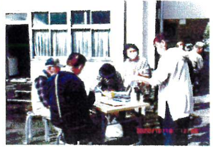
参加者受付・手指消毒