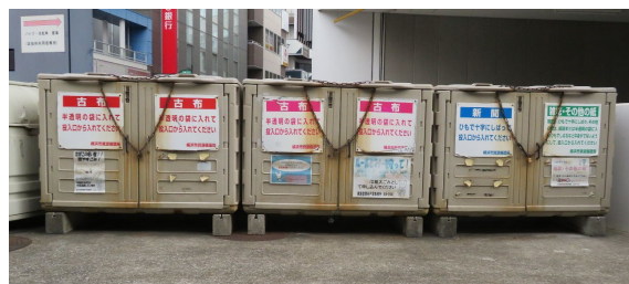
戸塚区役所に設置している資源回収ボックス