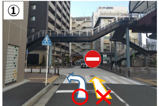
国道1号線側からの進入ができなくなります。