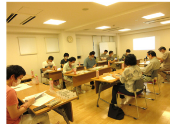
運営委員会の様子

次回 運営委員会：8月2日(日) 9:30マルチルーム 運営委員会の議事録はWEBまたはフロントで閲覧できます。