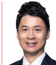
石井 亮次 氏 フリーアナウンサー

早稲田大学商学部卒業、名古屋市議員(平成7年4月当選後、7期連続当選)、名古屋市議員、指定都市議会議長、衆議院議員初当選(第49回総選挙)、自由民主党法務・自治関係団体委員会副委員長、自由民主党財政・金融・証券関係団体委員会副委員長、自由民主党地方組織・議員総局次長を経て、令和4年8月総務大臣政務官(第2次岸田改造内閣)