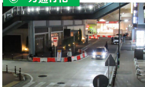
▲実験時のモディ裏道路の様子 (一方通行化)