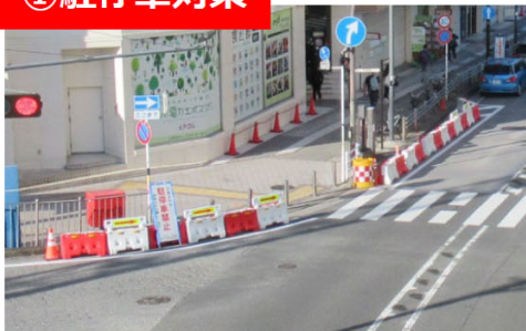
▲実験時の駅前道路の様子 (駐停車禁止エリア明示)