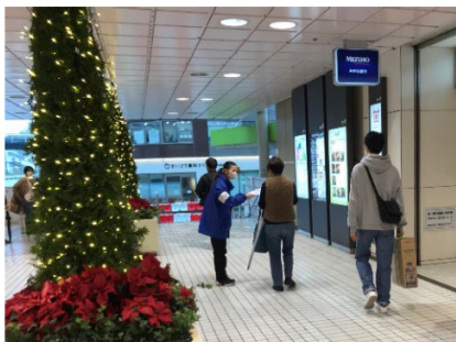
▲アンケート配布の様子