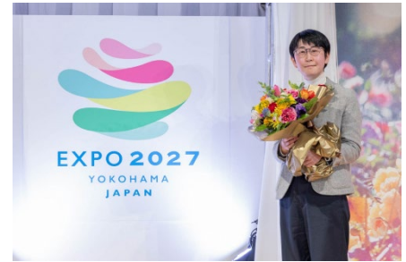
公式ロゴマーク最優秀賞作品と受賞者

応募総数 1,204 作品。「デザイン審査」、「知的財産権関連調査」を通過した最終候補作品から、2月8日に開催された「選考委員会」にて、最優秀賞作品が決定しました。