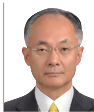
辻 琢也 氏 一橋大学大学院法学研究科教授

同志社大学文学部卒業後、CBCテレビにアナウンサーとして入社。バラエティ番組から報道番組まで幅広く担当する。「ゴソマ〜GOGO!Smile!〜」(CBCテレビ制作、月〜金13:55〜)の番組開始時からMCを務める。2020年3月にCBCを退社しフリーアナウンサーへ転身。2019年の週刊文春の好きなアナウンサーランキングでは、在京キー局の有名アナに混じって異例の5位、2021年のJ-CASTニュースの好きなワイドショーのMCでは1位を獲得。著書「ゴソマ石井のなぜか得する話し方」(ダイヤモンド社)などがある。