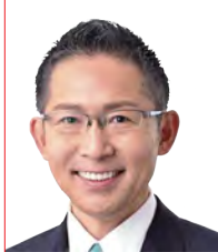
中川 貴元 氏 総務大臣政務官

早稲田大学商学部卒業、名古屋市議員(平成7年4月当選後、7期連続当選)、名古屋市会議長、指定都市議会議長、衆議院議員初当選(第49回総選挙)、自由民主党法務・自治関係団体委員会副委員長、自由民主党財政・金融・証券関係団体委員会副委員長、自由民主党地方組織・議員総局次長を経て、令和4年8月総務大臣政務官(第2次岸田改造内閣)