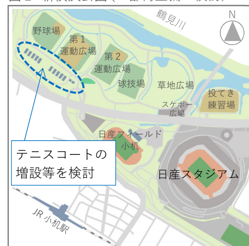
図2 新横浜公園（一部再整備の検討）