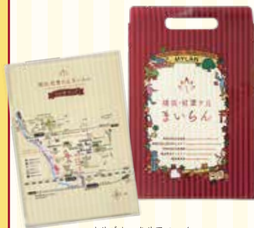
オリジナルクリアファイル

このチラシの下にある枠に、対象施設5館のスタンプを集めた方にはオリジナルクリアファイルをプレゼント！プレゼントは🌸目印のある館で交換できるよ（なくなり次第終了）。