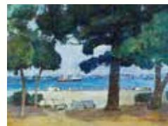
源田定夫(春光の横浜港)1988年 油彩、キャンバス 97.2x130.2cm

(1) 11:00~11:30 学芸員によるギャラリートーク (2) 13:30~15:30 おしゃべりステーション@コレクション展 作品を見て感じたことを鑑賞サポーター(ボランティア)とお話しませんか? おすすめ作品の紹介も随時行います。