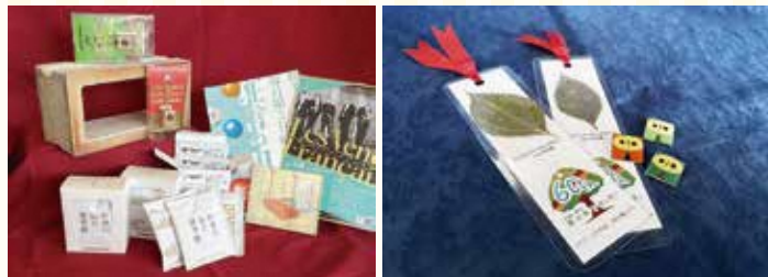
抽選賞品（チケット、CD、キーホルダー、コーヒースト、ホローブリック）

公演のチケットや特別なグッズなど豪華景品が抽選で当っちゃうかも…？ スタートとゴール地点は、県立青少年センター1階設置の「まいらんブース」だよ。ぜひ参加してね！