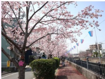
シンダイアケボノの桜並木（鶴巻橋付近）

天気良く暖かい日のため、散歩をしている人が多く見られました。シンダイアケボノは開花して見ごろです。ソメイヨシノは所々開花していました。