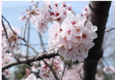
青空の下、ソメイヨシノのピンク色がきれいです。（清水橋付近）

大岡川のソメイヨシノは満開を迎え、散り始めの場所もできました。咲き誇る桜と桜吹雪、花筏をお楽しみいただけます。