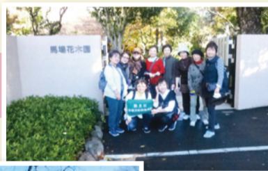
裏門から入りました