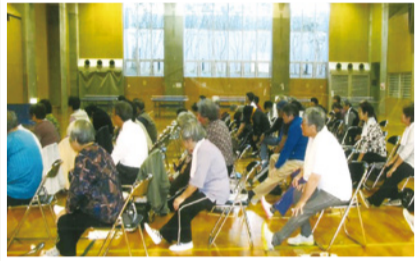
座って動かすから、かんたんね～

年に一度、秋に潮田地区センター体育室で体操教室を開催しています。午前の1時間半ほど、休憩を挟みながら動きます。椅子に腰かけてできる軽い体操から始まって立ち上がり、体全体を動かしていきます。地域の方が50名以上参加される行事です。動きやすい靴とタオル1本用意すればどなたも気軽に参加できます。この体操教室をきっかけに「まず体を動かす！」ことの大切さを感じて、毎日の健康維持につなげていただきたいです。