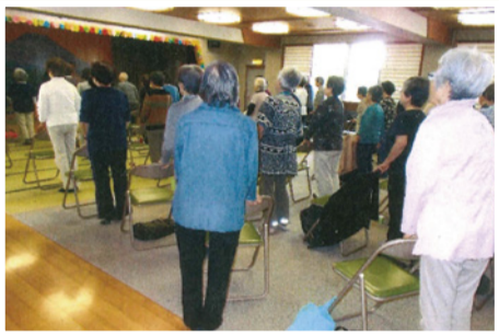
イスを使ってかかと上げをしているところです

ひざひざワックン体操を毎月2~4回火曜日に行っています。地区センターの鶴寿荘でいこいの場のようにわきあいあいとお互いのことを気づかいながら笑顔のなかに静けさがあり、講師とあうんの呼吸で体操を楽しんでいます。時間は、午後1時30分受付で2時~3時30分まで体操で中休みを15分取りながら汗をほどよく流しています。