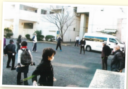
準備体操をしっかりとやりましょう。

矢向地区では、毎月第2月曜日9時30分から矢向地区センター前に集合し、ノルディックウォーキングを開催しています。参加者20名検温・消毒・準備体操等を行い、途中休憩して約1時間の健康づくり活動を実施しています。保健活動推進員と矢向地域ケアプラザ職員と協力して事故のない安全なルートで、連携しながら誘導しています。季節折々に咲く草花を鑑賞しながら、すれ違う人たちと声を交わしながら今後も活動を続けて行きます。