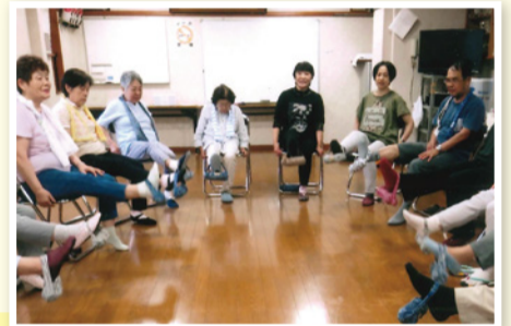
ペットボトルを使って足・腕を強くする

尻手地区では、毎月第4火曜日の午後2時から1時間半位、手拭い、ボール、水のいったペットボトル等で、体全身の運動、脳トレ体操をそれぞれの方の様子を見ながら行っています。終わった後は、自分の近況等情報交換をし、地域の健康づくりや人との繋がりを大切にして今後も続けて行きたいと思っています。