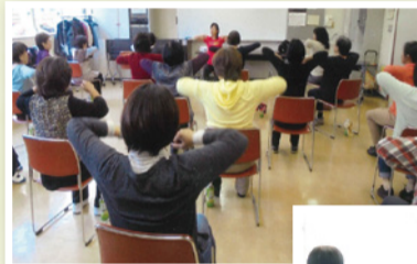
「イスを使った体操」まずは、簡単な腕上げから

コロナ禍のため、大勢の活動は控え、地区の保健活動推進員のみで講習会を行っています。今年度は栄養士さんをお願いして、食について勉強し改めて食生活を見直しました。