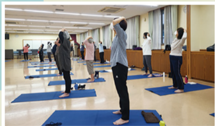
運動始めは辛いが、帰りは軽やかな足どり♪