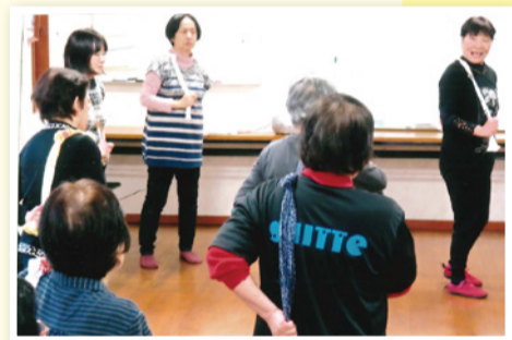
手拭いを使って上から下へと血流をよくする