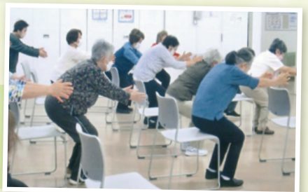
椅子に座るか座らないかというところでスクワット