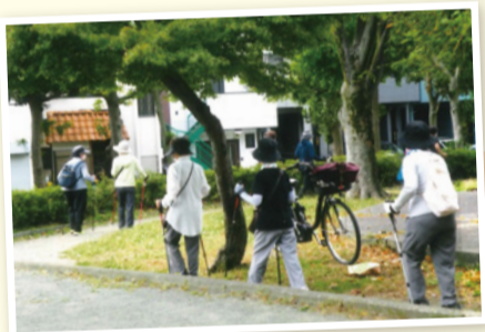
安全な遊歩道をウォーキング！