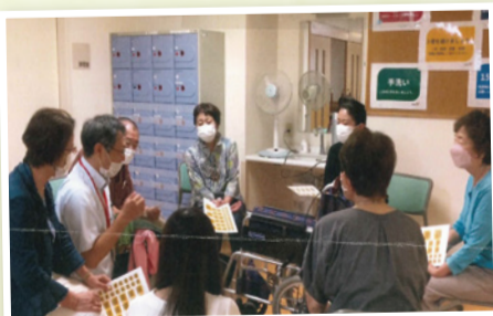
わになるネット勉強会

活動の当初の目的は、ウォーキングを通し、また人とのつながり体力づくりの予定でしたが、施設の工事中、コロナ禍等、計画を一部変更せざるをえません。やっとコロナ減少で11月11日に谷中ウォーキングを決定、先日谷中散策下見を実現しました。各地区メンバーが育児教室に参加しています。町代表が「認知症SOSネット」「フレイル予防等」の講習に参加、これらの講習を各地区でフィードバック、活動に結びつけていきます。