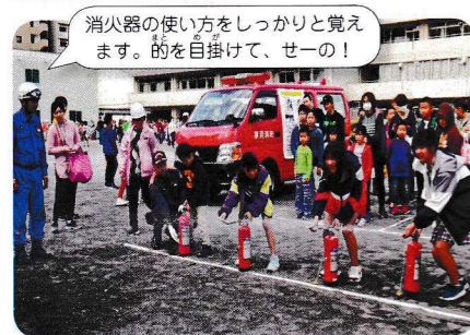
消火器の使い方をしっかりと覚え ます。的を自掛けて、セーの!