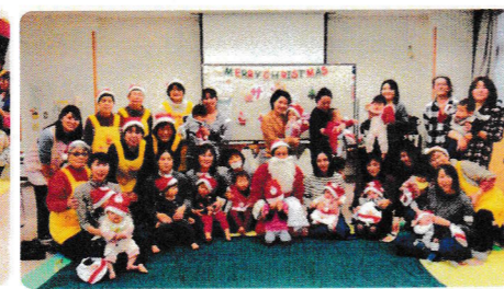
サンタさんからプレゼント 嬉しいな~