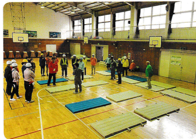
1メートル×2メートルはおおよそマット1枚分