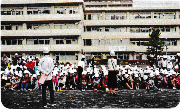
南吉田小学校児童集合