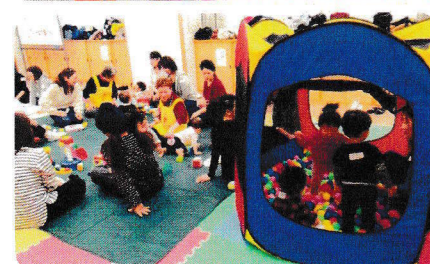
ボールプール楽しいな(^_^)

子育て中のママやパパと子ども達の『ほっ!とひといき安心スペース』として平成25年11月に開所されたサン・サンディも今年で満6歳! 10月には60回目が開催されました。令和元年9月からはこども部屋の方々のご協力を得て、わらべ歌遊びや紙芝居も始まり、より楽しいひとときとなっています。笑顔あふれる楽しい親子の居場所『サン・サンディ』に気軽にお立ち寄りください。申し込みは不要です。