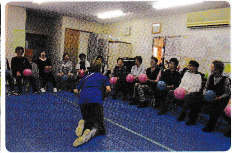
11月、2月と年2回の お達者塾です。 脳トレも兼ねています。