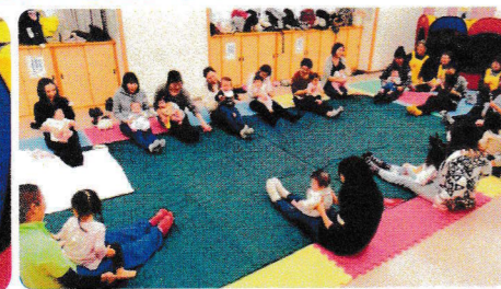
ママ頑張っ!親子体操