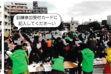
訓練参加受付カードに 記入してください