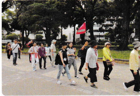
年に一度の健康ウォーキング 皆さん良い汗を流しながら 3.2kmを楽しみました。