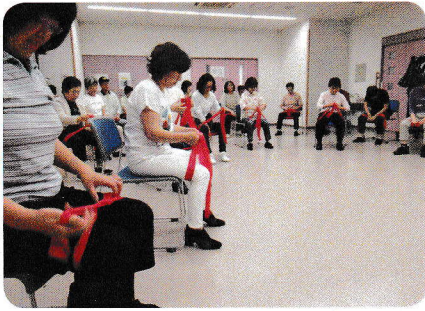
毎月第二火曜日（午後1:30～3:00） に行っている。 健康体操 チューブ体操の様子です。