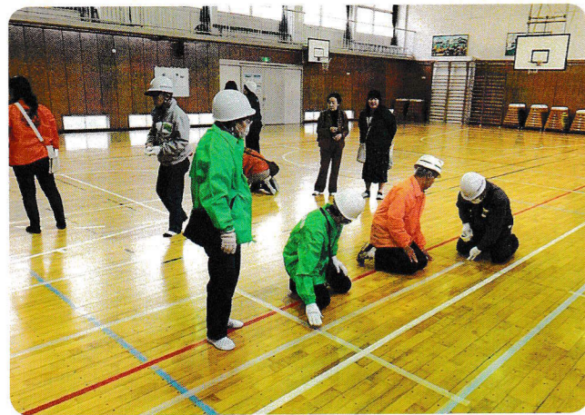
1メートル×2メートルが基本で計測をする