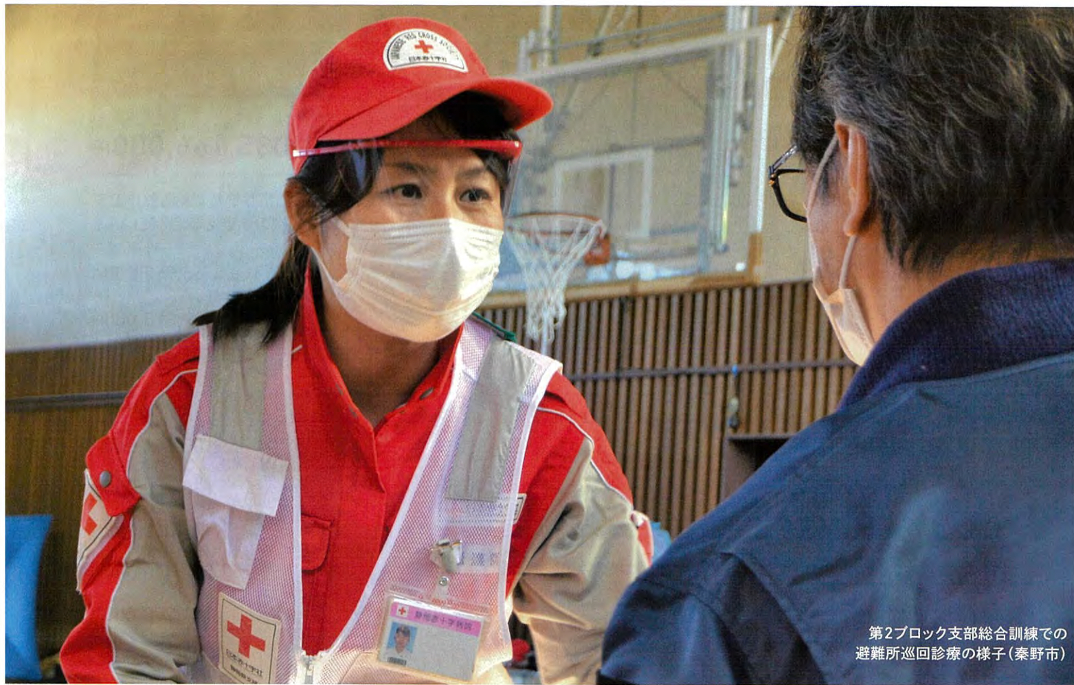
第2ブロック支部総合訓練での 避難所巡回診療の様子(秦野市)