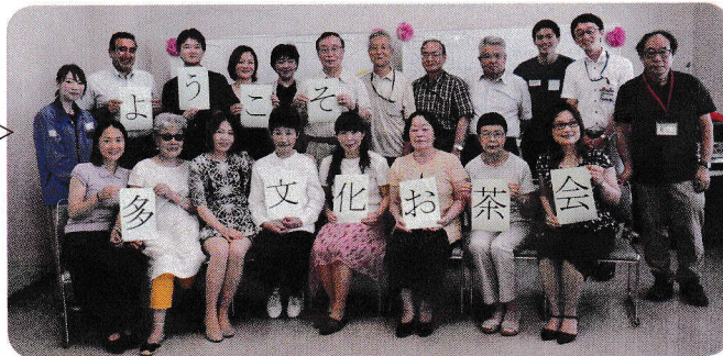
第2回・2019年7月26日 万世・永楽・真金(1)(2)