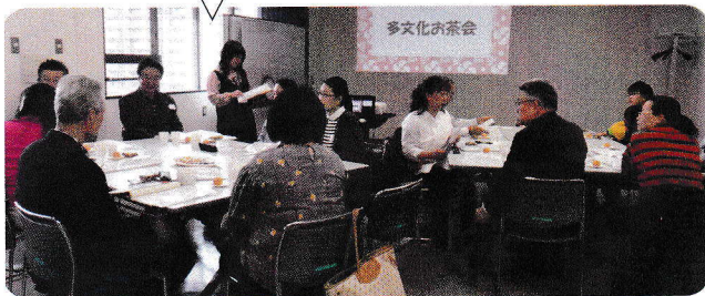
第1回・2019年4月14日 永楽・真金(2)