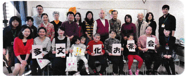
第3回・2019年12月14日 浦舟(東)白妙(1)・高根(東)