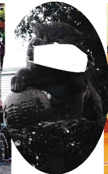
お三の宮日枝神社の ごまいぬ 狛犬もマスク姿