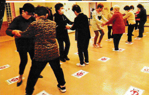
寿東部地区老連女性部「きらきらクラブ」