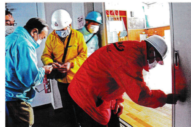
体育館・防災倉庫の鍵の確認

寿東部地区地域防災訓練が11月21日、南吉田小学校で行われました。コロナ禍のため10町内各2名ずつの参加でした、震度5以上を想定した夜間の小学校の出入口を確認しました。