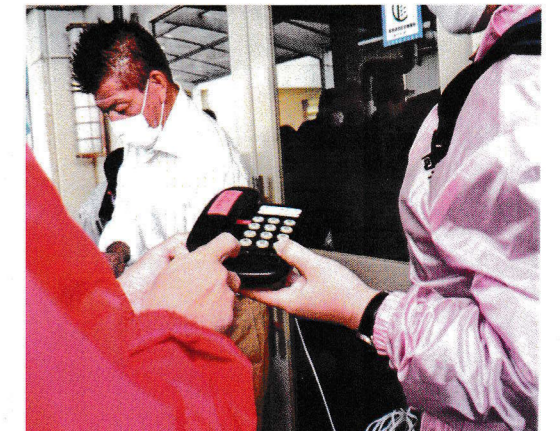
区役所とのホットラインの確認