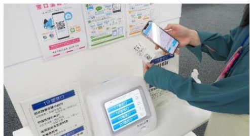
窓口混在状況のリアルタイム配信

区ホームページからの窓口混雑状況の配信など、区役所利用者の利便性向上を図るほか、来庁者に配慮した庁舎環境を整備します。