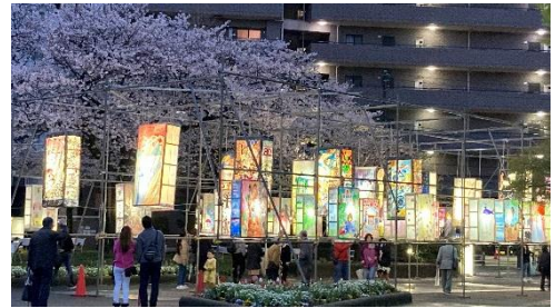
みなみ桜まつり 絵どうろう

自治会町内会、地域団体、企業など区民の皆さまと区役所が一体となって、区制 80 周年を祝う取組を進めていきます。