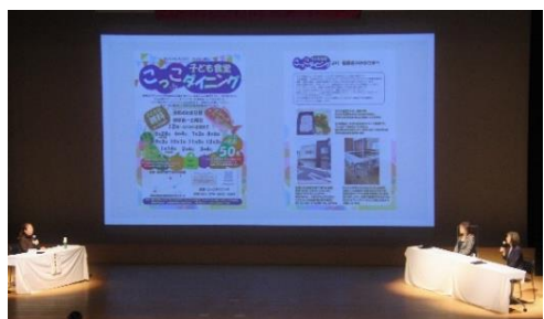
南区地域活動発表会

迅速かつ丁寧な広聴を行うとともに、マスコットキャラクター「みなっち」やSNSを活用するなど、様々な媒体を通して、幅広い年代に対して区政情報等を効果的に発信します。また、南区に関する各種統計資料をまとめた統計概要を発行します。