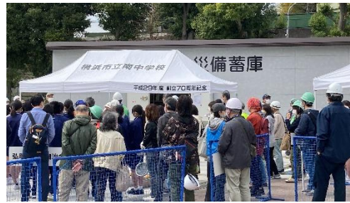
地域防災拠点 拠点訓練

災害時、自らの身を守るための「自助」意識向上、地域で共に助け合う「共助」、災害対応力の向上のための「公助」に取り組みます。