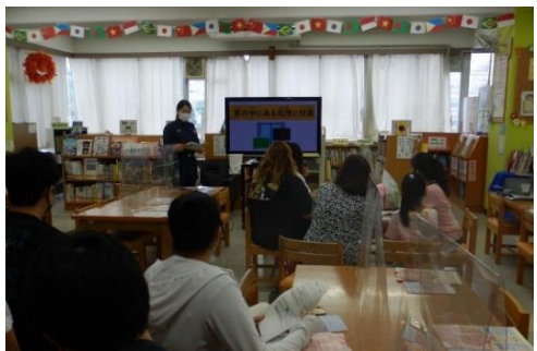
外国人への生活ガイダンスの様子

区内に暮らす外国籍等の住民と地域社会がともに暮らしやすいまちづくりを進めるため、区役所やみなみ市民活動・多文化共生ラウンジにて情報提供や生活相談等を行います。