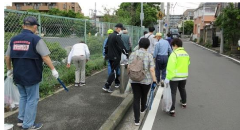
南区つながり清掃ウォーク

横浜市一般廃棄物処理計画（ヨコハマ3R夢プラン）の削減目標に向け、区民・事業者・区役所が目標を共有し、協働のもと、ごみの発生抑制と減量化を進め、きれいな街づくりを推進します。