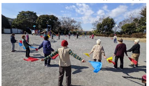
公園での介護予防活動

誰もが「健康で安心して笑顔で暮らせるまち」を目指し、地域や関係団体と行政、関係機関等が連携し、地域の課題解決や見守り、支えあいの地域づくり等に取り組みます。