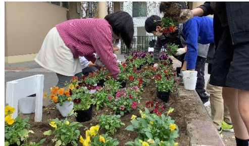
小中学校等への花苗等の配布

「安全で安心して暮らせる街づくり」のために、交通安全対策や防犯活動支援等を行うとともに、地域での意識を高める啓発を実施します。