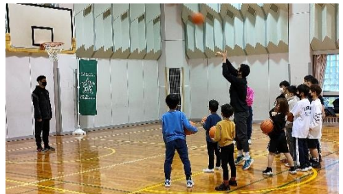
みなっちスポーツフェスタ

地域のふれあいや賑わいを創出する魅力ある商店街づくりを支援することで、地域及び商店街の活性化を図ります。