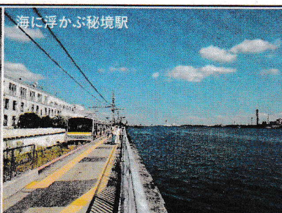
海に浮かぶ秘境駅