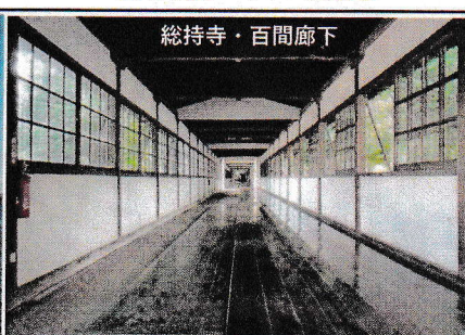
総持寺・百間廊下