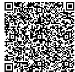
横浜市電子申請システム

【宛先】南消防署 総務・予防課予防係 家庭防災員担当 宛 ○郵送：〒232-0024 横浜市南区浦舟町2-33 ○FAX：045-253-0119 ○電子メール：sy-minamiyobo@city.yokohama.jp