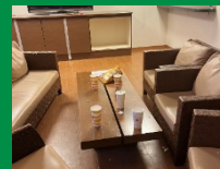
ラウンジのゴミの放置

子どもたちがルールを守って遊び、ゴミも持ち帰って、帰宅時間も守るように、各ご家庭で再度お子様にお話をお願いいたします。