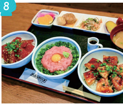
ちりとてちん 1,950円(税込)