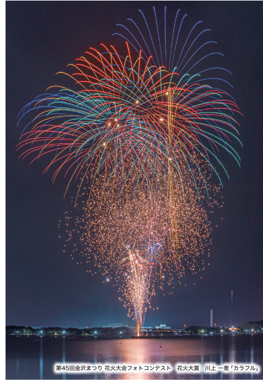
第45回金沢まつり花火大会フォトコンテスト 花火大賞 川上一恵「カラフル」