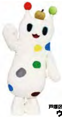
戸塚区のマスコット ウナシー