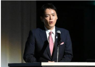
横浜市長 山中 竹春