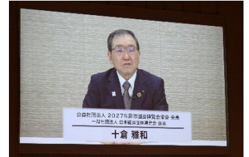
2027年国際園芸博覧会協会 会長 十倉 雅和