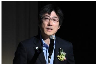
農林水産大臣政務官 舞立 昇治