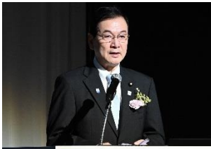
国土交通副大臣 堂故 茂