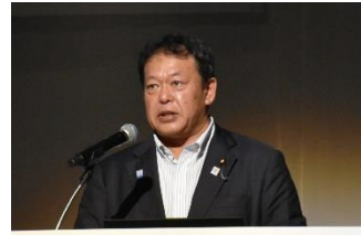
経済産業大臣政務官 石井 拓