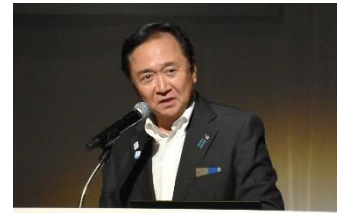
神奈川県知事 黒岩 祐治