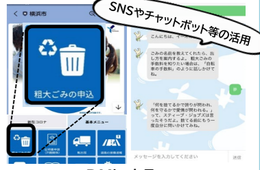
DXによる行政サービスの向上と効率化