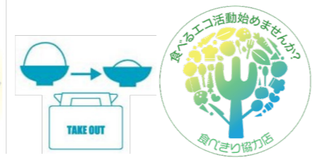
小盛りやテイクアウトの飲食店を認定する「食べきり協力店」の利用促進