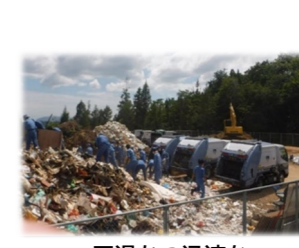
円滑かつ迅速な災害廃棄物の処理