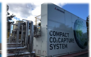
焼却工場のCO 2 回収(CCUの実証試験)