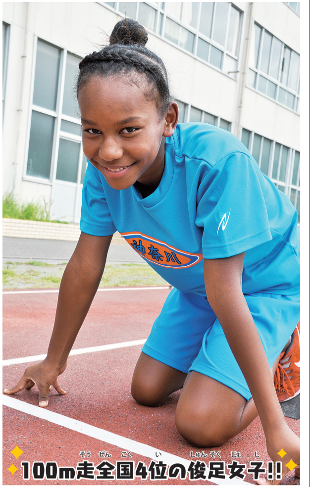
100m走全国4位の俊足女子!!