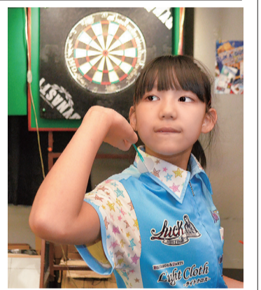
床からの中心までの高さは173cm。それに対し井出さんの身長は145cm。