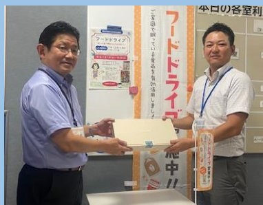
横浜新都市センター株式会社様他 皆様のご協力ありがとうございました。