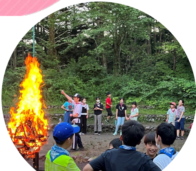
ふれあいキャンプ