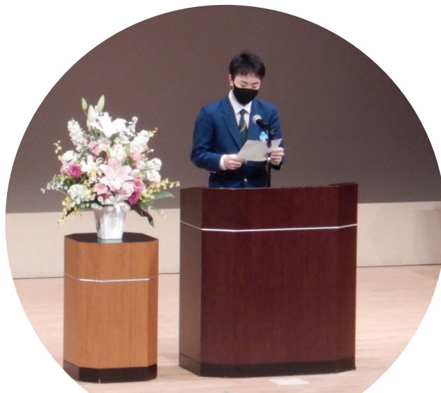
ボイス・オブ・ユース (青少年の主張)