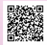
保土ヶ谷区ホームページ