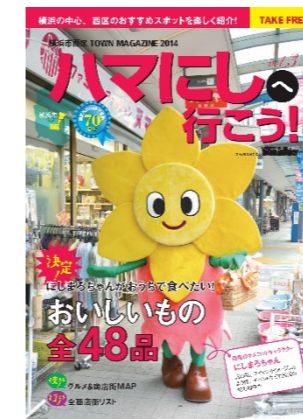
西区の商店街・個店をつなげる冊子の発行