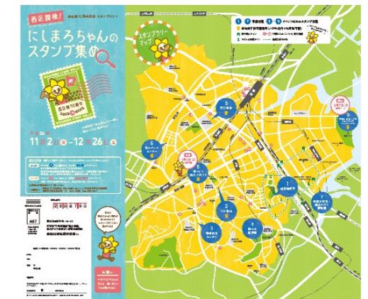
西区の魅力を再発見してもらう スタンプラリー