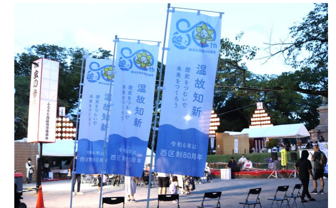
ロゴマークを活用した PRグッズで機運醸成