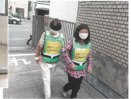
誘導ボランティア体験の様子