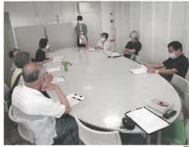
役員研修での意見交換の様子

区社協は地区社協の皆さんが活動しやすい環境づくりのため、研修会や役員会の実施、また活動費の助成などを行っています。