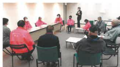
災害ボランティアセンター運営シミュレーション訓練の様子（左：受付訓練）