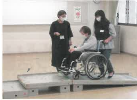
入門講座の車イス体験の様子

移動に関する相談をワンストップでお受けする窓口です。移動に困難を抱える障がい児・者からの相談に応じて、支援制度のご案内や、サービス事業所等の紹介・コーディネートを行っています。また、新規ボランティアの発掘および育成を目的とした、ボランティア向け入門講座や交流会等も実施しています。