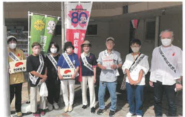
永田みなみ台 民生委員・児童委員の皆さん

皆さまから寄せられた募金は、区内の子ども食堂・高齢者サロン・障がい児者団体などの福祉活動を行う団体や社会福祉施設へ助成されています。地域で必要とされている活動に助成することで、たすけあいによる暮らしやすい町をつくっていきます。赤い羽根共同募金へのご協力をお願いいたします。