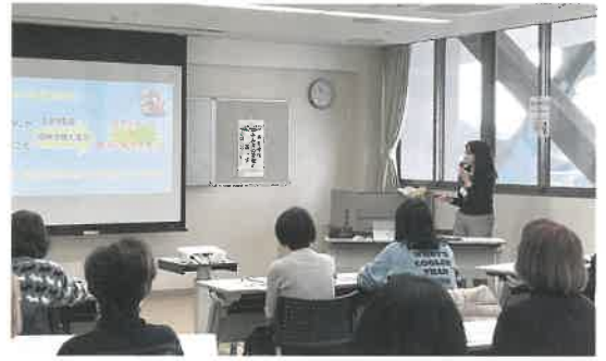
ボランティア入門講座の様子

ボランティアをしたい人と、してほしい人をつなげるはたらきをしています。また、ボランティア活動を広げるために様々な講座を開催しています。「ボランティアをしたい」「ボランティアの力を借りたい」と思ったら、ご相談ください。裏面ボラびにも最新情報を載せていますのでご覧ください。