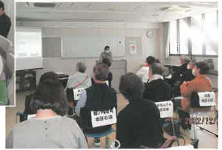
事務局長会議の様子