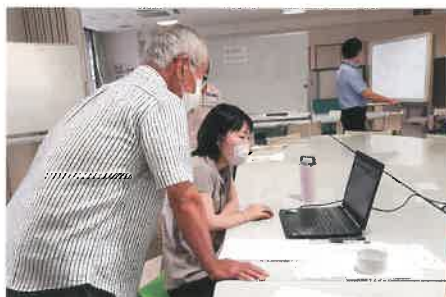
システムを活用したボランティア情報の確認の様子

区災害ボランティアセンターの設置・運営を中心に担います。また、平時から南区災害ボランティアネットワークや区役所などと連携をしながら被災時にむけて準備・検討を行っています。