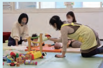
にしとも広場での様子