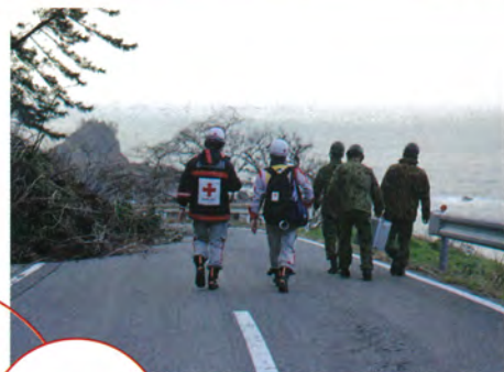
▲寸断された道路を自衛隊員と進む同救護班(石川県珠洲市)