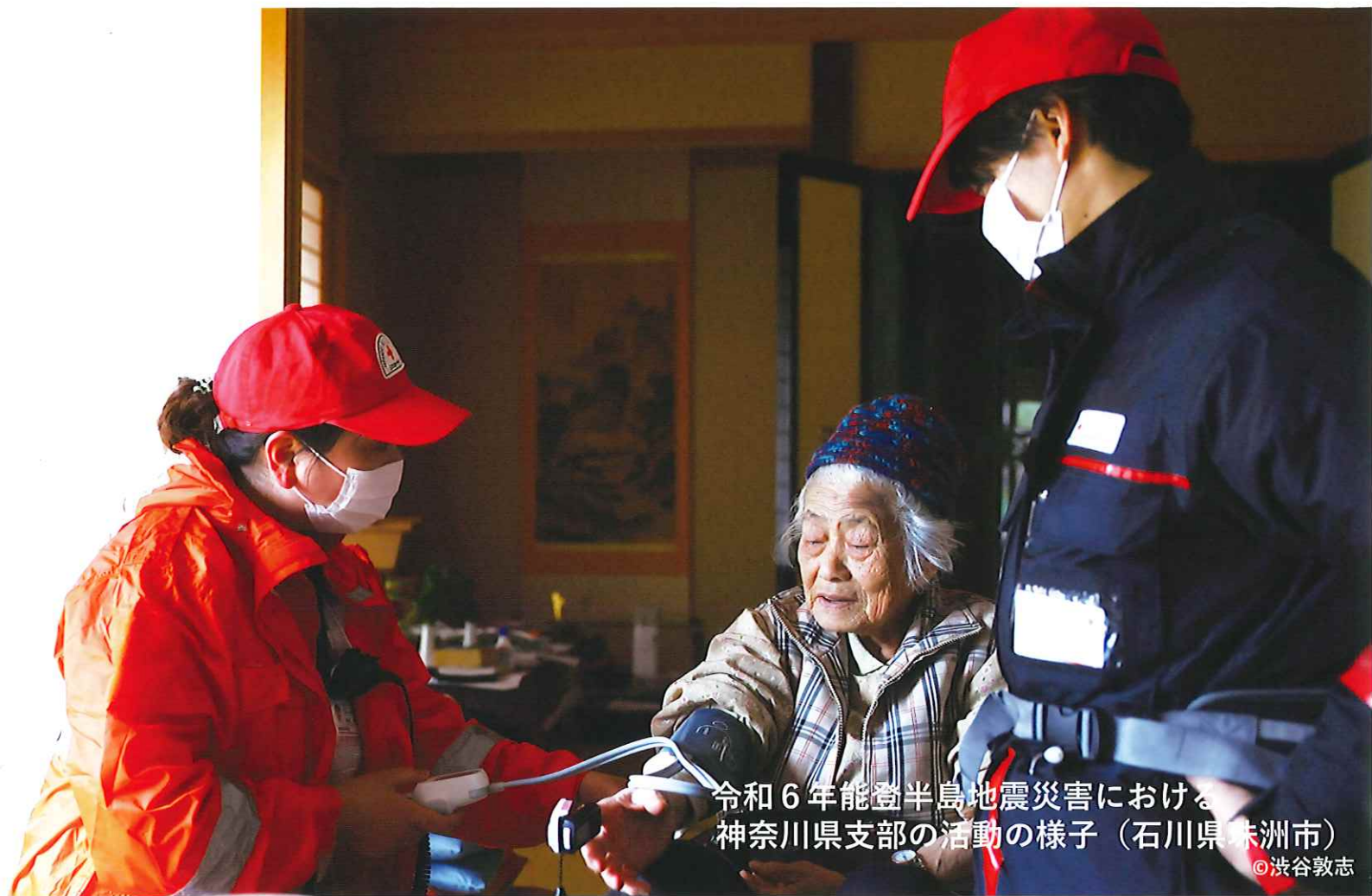
令和6年能登半島地震災害における 神奈川県支部の活動の様子（石川県珠洲市）