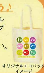
オリジナルエコバック イメージ