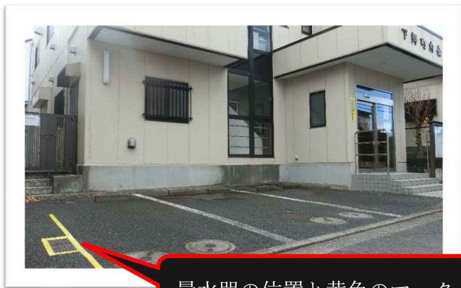
量水器の位置と黄色のマーク

水道局からのお願いでもあります。駐車場を使用されるドライバーの方々が「黄色のマーク上に駐車しない」こと、を守って頂きますようお願い致します。