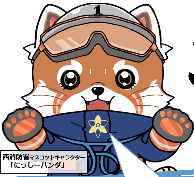
西消防署マスコットキャラクター 「にっしーパンダ」