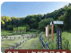
名瀬・上矢部市民の森