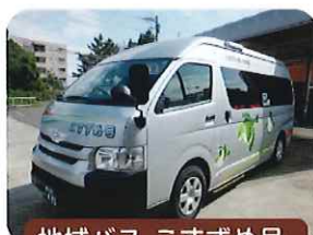
地域バス こすずめ号

歴史と緑豊かな地域での多目的交流スペース の運営や、生活環境の向上に努めた地域住民 の取り組みを紹介します。