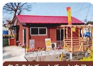
ちえのわチュンチュンカフェ