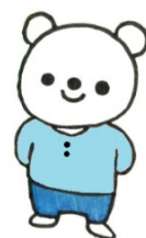
白根地区センター キャラクター しらねっち

住所：横浜市旭区白根4-6-1 TEL：045-953-4428 FAX：045-953-4461 開館時間：月～土9時～21時、日曜・祝日9時～17時 休館日：第2月曜日、年末年始