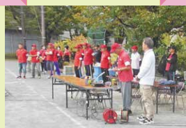
やっと行事が 復活してきました！