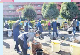
ふれあい 餅つき大会