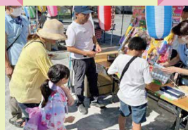
地元地区の 人達と共に