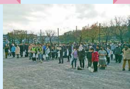
クリーン活動開催