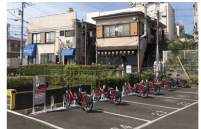
集合住宅への設置例