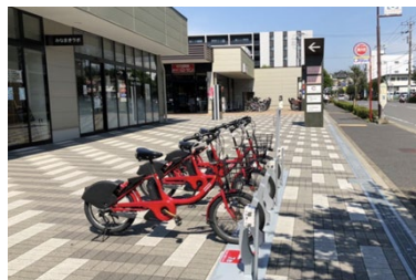
商業施設への設置例（相鉄ライフ南万騎が原）