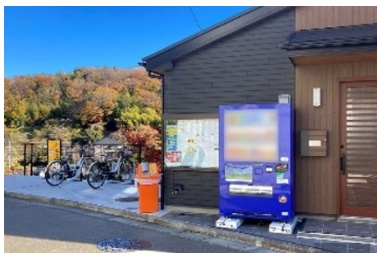
自治会町内会館への設置例