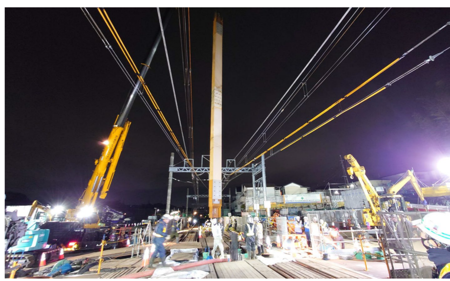
第1工区 【発進立坑の土留壁設置を進めています】

シールドマシン発進に必要な立坑をつくるため、土留壁工事を実施しています。線路の下に土留壁を設置する必要があるため、電車の運行が終了した後、線路を取り外して、作業を行っています。近隣にお住まいの方などの安全に十分配慮して、工事を進めていきます。