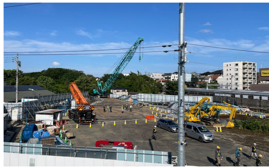
第2工区 【土留壁工事に向けた準備を進めています】

鶴ヶ峰駅北口に位置する作業ヤード内には、地下に新たな鶴ヶ峰駅を建設します。建設に必要な土留壁工事のための準備作業として重機の組立及び資材の搬入を行っています。近隣にお住まいの方や鶴ヶ峰駅を利用する方などの安全に十分配慮し、工事を進めていきます。