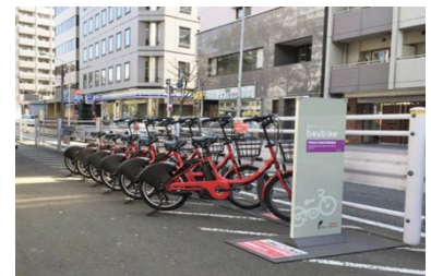
駐輪スペースへの設置例（伊勢佐木長者町駅）