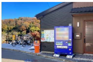
自治会町内会館への設置例