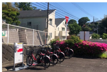
集合住宅への設置例