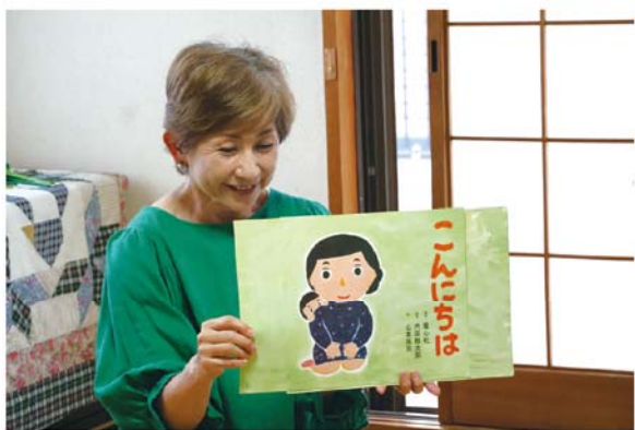
やさしい声で「お話し会」