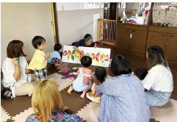
「ぐらんまのいえ」のイベントのーコマ

糸賀： 私も、ここがあるからとても助かっています。子育てに一生懸命なお母さん達に寄り添い、子どもたちの成長を一緒に見守っていけたら、と願ってい