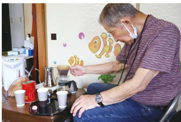
「にしろく・ふれ愛カフェ」のこだわりのコーヒー

秋末：特技などを活かしたいときに、ここを使って何でもできることを知ってもらえれば嬉しいです。