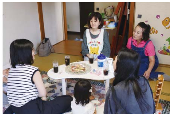
「にこにこママのホットタイム」

伊藤：このバザー自体が「居場所」になって、面白いつながりが生まれていますね。家の不用品を寄付してくれる人、おしゃべりしているうちにここで講座