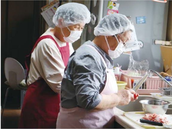
今日のランチはカレー？ サラダ作り中!!

体操や健康麻雀を開催しています。健康麻雀は町内会長さんのお勧めもあり、7～8年前から定着しています。台や牌も地域の方が寄付してくれました。また当初より「食」を大切にしているので、サービスBとシニアサロンの日には、スタッフによる手作りのランチも提供しています。