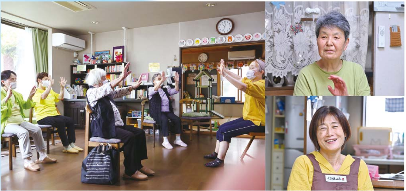
「椅子に座って体操」グーチョキパー（左）