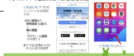
↑ 事例発表の一部抜粋