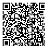
事例発表の 二次元コード