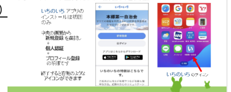
↑事例発表の一部抜粋