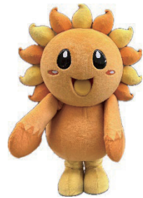
※写真は着ぐるみ「大」です。

※大・小ともに推奨身長以外の方が着用するとバランスが崩れたり、動作が難しくなったりする恐れがありますのでご注意ください。