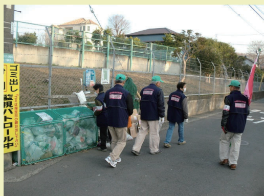
集積場所パトロールの様子

環境事業推進委員の身分はボランティアであることから、活動中の補償につきましては、市民活動保険等により補償を行うこととします。