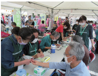
↑健康フェア(10月) —健康づくり委員会

19地区がそれぞれ4つの委員会(健康づくり委員会・禁煙推進委員会・広報委員会・子育て支援委員会)に分かれ、委員会ごとのテーマにあわせた活動をしています。