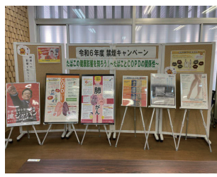
↑世界禁煙デー キャンペーン(5月) —禁煙推進委員会