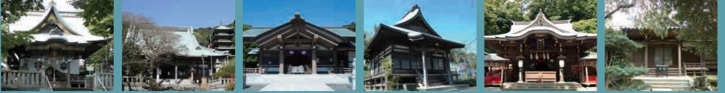
白旗神社(毘沙門天) 知恵と勇気の守り神 龍口寺(毘沙門天) 知恵と勇気の守り神 皇大神宮(恵比寿) 商売繁盛の神 養命寺(布袋) 不老長寿・無病息災の神 江島神社(弁財天) 商売・芸能の神 感応院(寿老人) 長寿の神